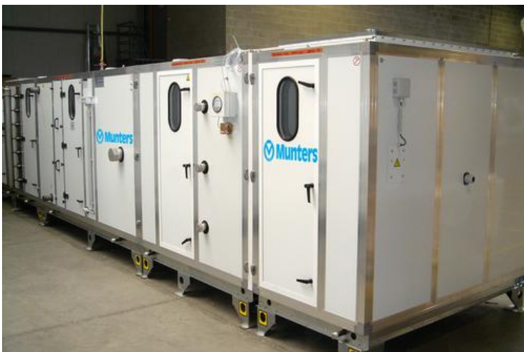
Munters NA 2005 Gerät

Über 30 Geräte wurden an Kunden von Pharmadule geliefert, von 5.000 bis zu 30.000 m 3 /h.